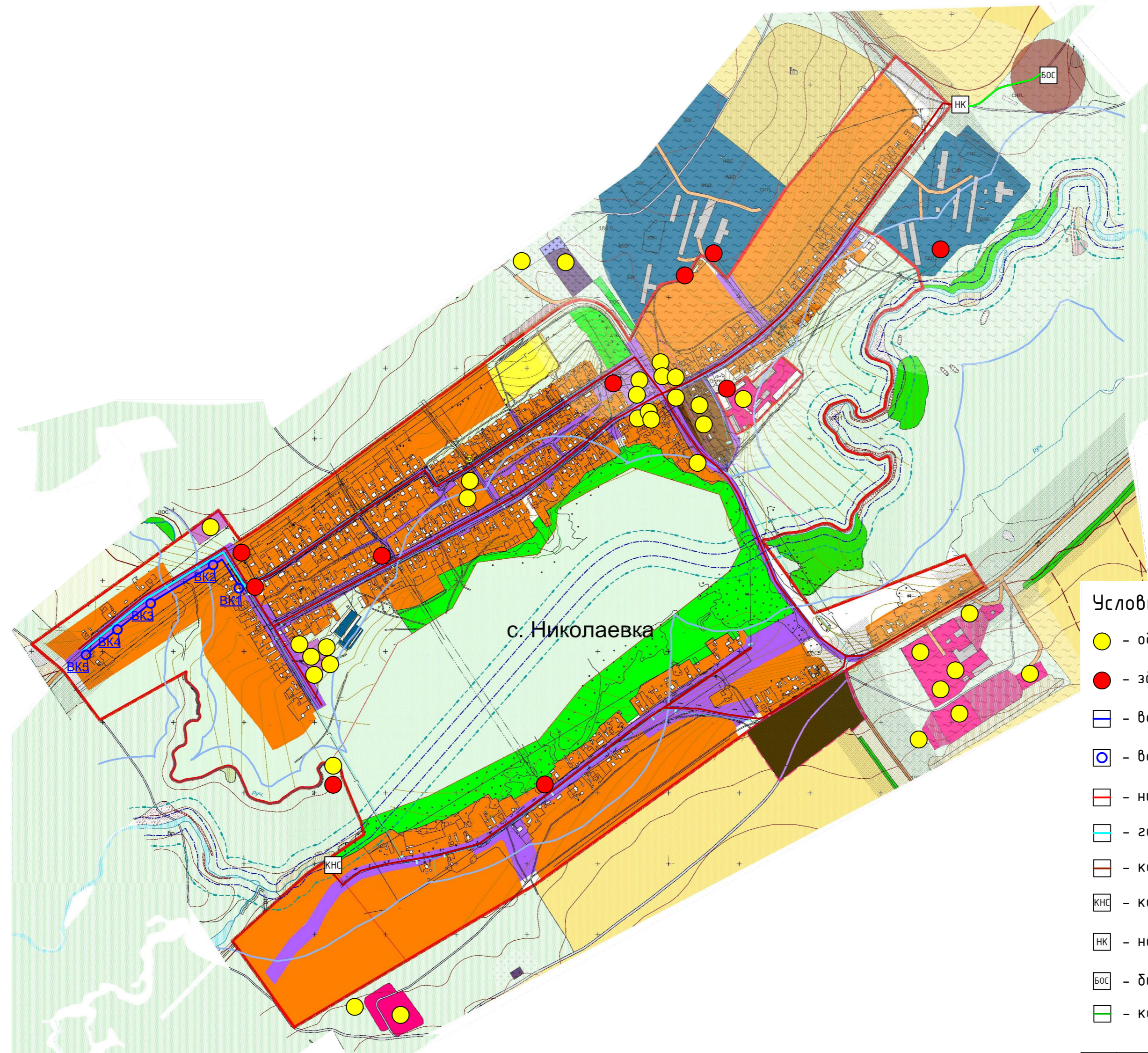
Схема перспективных сетей коммунальной инфраструктуры с. Николаевка. М 1:10000