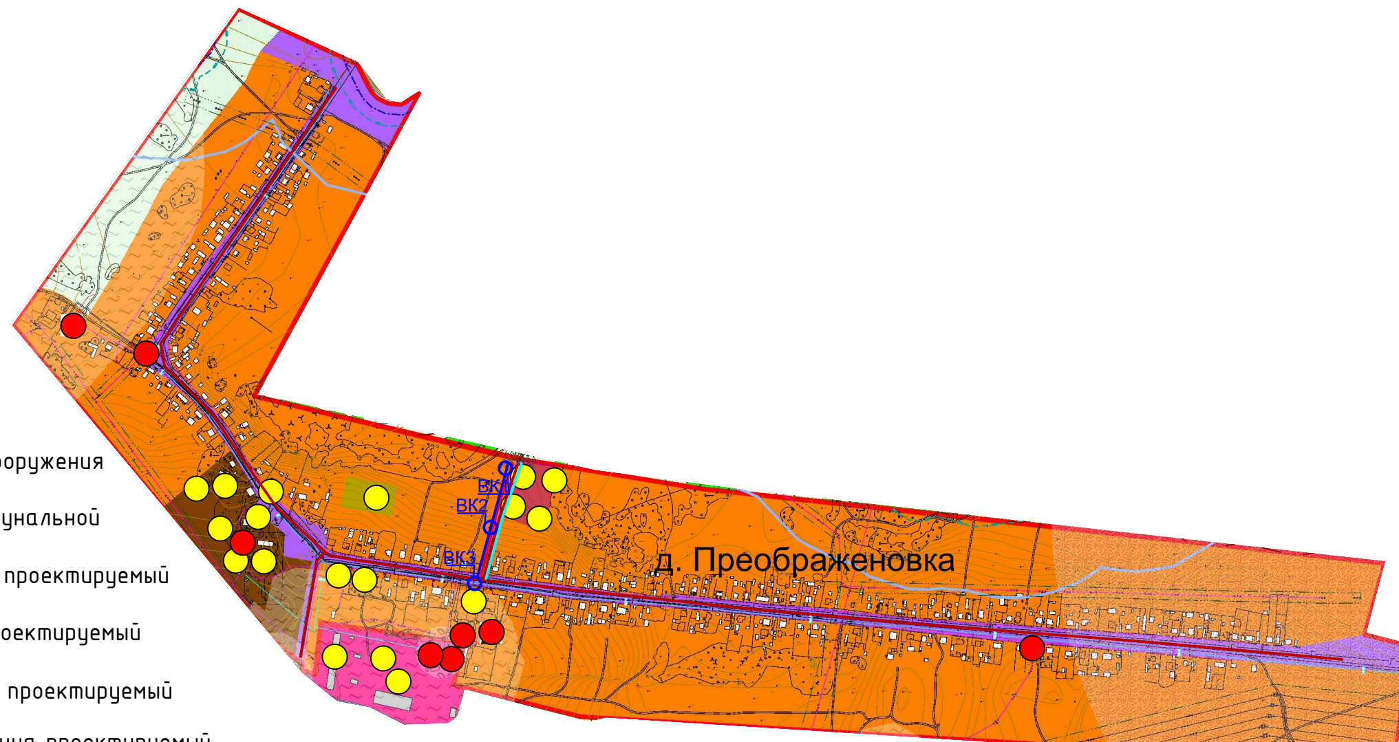
Схема перспективных сетей коммунальной инфраструктуры д. Преображеновка. М 1:10000